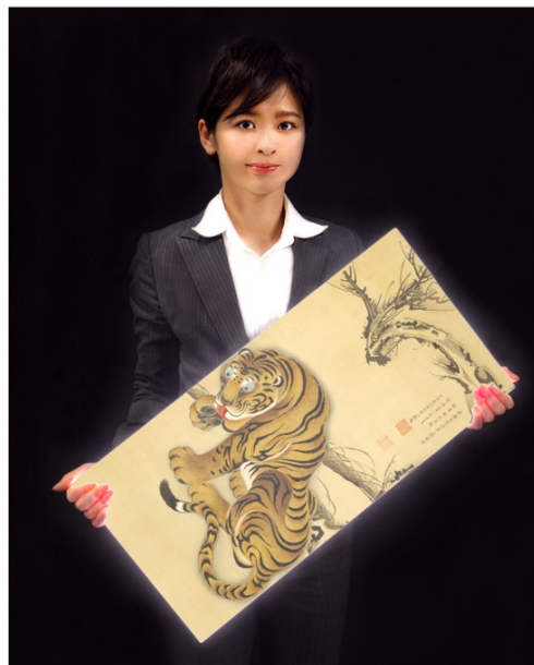
伊藤若冲「虎図」(ハメコミ合成画像です) エツコ&ジョー・プライスコレクション